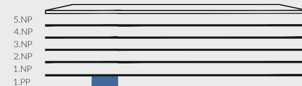
pohled na fasádu - schéma / facade view - scheme